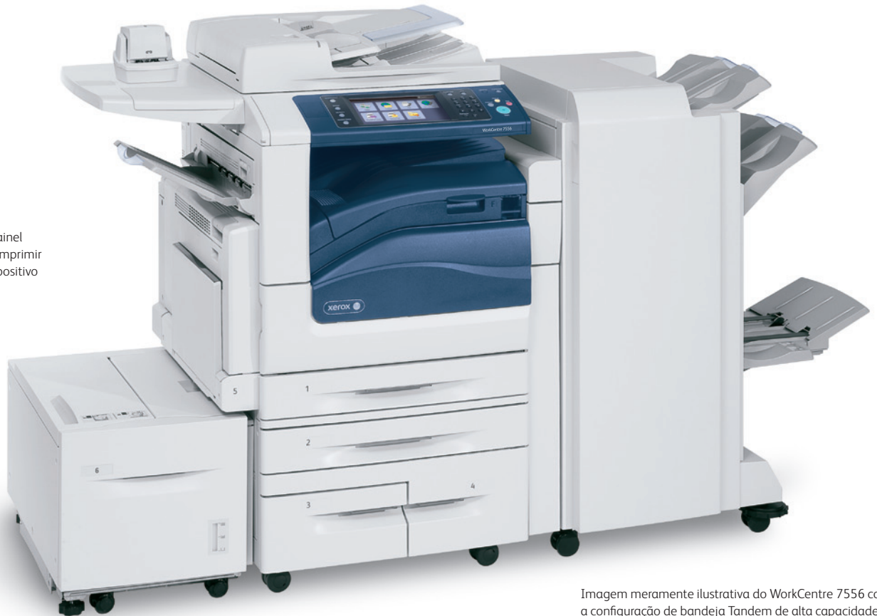
Imagem meramente ilustrativa do WorkCentre 7556 com a configuração de bandeja Tandem de alta capacidade, Grampeador de conveniência e Superfície de trabalho, Alimentador de alta capacidade opcional e Módulo de acabamento Profissional opcional.

A porta USB de conveniência do painel dianteiro torna mais rápido e fácil imprimir de ou digitalizar para qualquer dispositivo de memória USB.