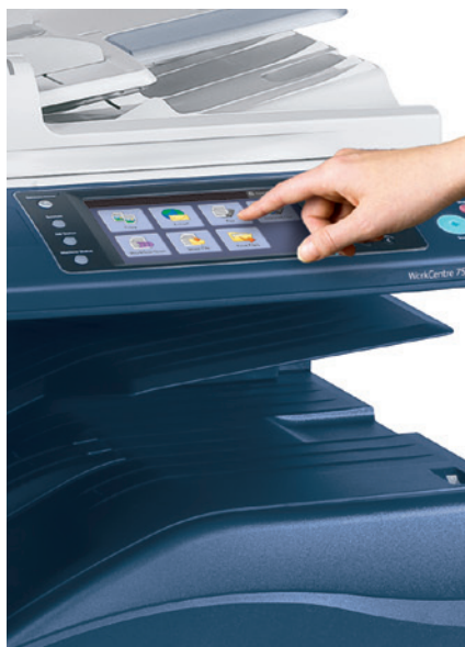
Soluções personalizadas que você acessa diretamente da interface da tela de seleção por toque.

Estes são apenas dois exemplos das possíveis Soluções de Fluxo de Trabalho Xerox.