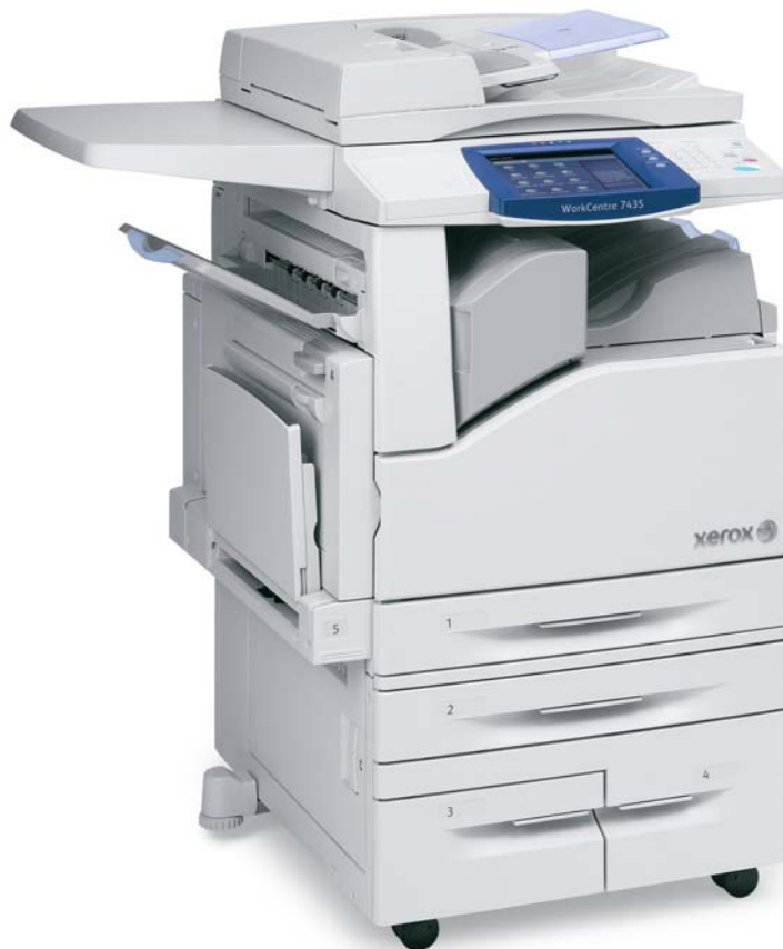
WorkCentre 7435 com superfície de trabalho, bandeja tandem de alta capacidade e módulo de acabamento de escritório integrado