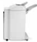
Módulo de acabamento de alto volume