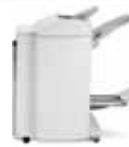
Módulo de acabamento de alto volume com criador de livretos