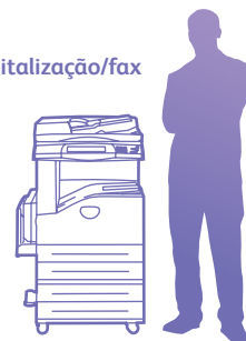
WorkCentre 5225 com módulo de duas bandejas