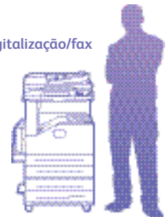
WorkCentre 5222 com módulo de duas bandejas (disponível no Brasil apenas com stand)

25,2 x 25,7 x 43,8 pol. 640 x 652 x 1.113 mm