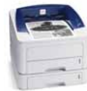
A Phaser 3250 exibida com Bandeira 2 opcional